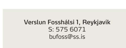
Verslun Fosshálsi 1, Reykjavík S: 575 6071 bufoss@ss.is